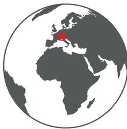
Senoplast Klepsch & Co. GmbH, Austria