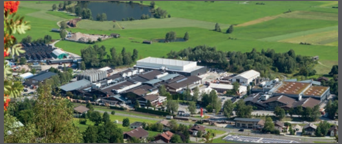
Senoplast Klepsch & Co. GmbH · Piesendorf · Austria · Headquarters

Wilhelm-Klepsch-Str. 1 A-5721 Piesendorf · Austria Tel.: +43 6549 7444 · Fax: +43 6549 7942 VAT ATU61875849 · DVR 0117536 Email: austria-office@senoplast.com www.senoplast.com