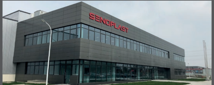
善诺胜新材料（苏州）有限公司 · 苏州/吴江.中国

南巷路688号 吴江经济技术开发区 江苏省.中国 电话: +86 512 6395 1808 邮箱: china-office@senoplast.com www.senoplast.com/cn