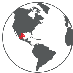
Senoplast S.A. de C.V., Mexico

本手册中所述的技术数据由Senoplast Klepsch&Co.GmbH根据其所知所信，基于Senoplast的现有知识和经验编制而成。数据不具约束力，不代表材料规格或对某些特性的保证。买方不能免除对产品进行他们自己的测试和检查是否适合各自的应用。Senoplast对此不承担任何责任。本说明书如有更改，恕不另行通知。在第三方因侵犯财产权而提出索赔的情况下，买方或第三方的赔偿不能直接或间接地给予。