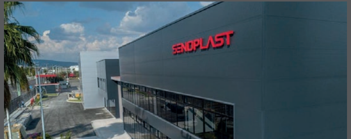
Senoplast S.A. de C.V. · Querétaro · Mexico

Parque Industrial Querétaro · Av. La Noria No. 123 C.P. 76220 Santa Rosa Jáuregui, Qro. · Mexico Tel.: +52 442 192 4600 · Fax: +52 442 215 9349 Email: mexico-office@senoplast.com www.senoplast.com/es