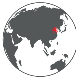
Senoplast New Material (Suzhou) Co. Ltd., China